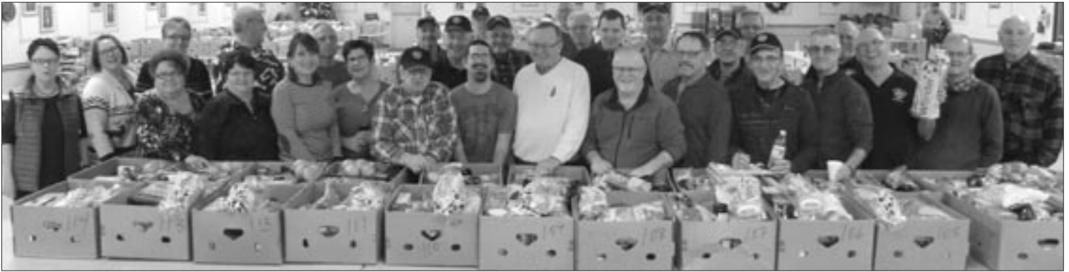
Les bénévoles, Chevaliers de Colomb et Filles d'Isabelle lors de la préparation des boîtes de Noël.

G âce à la générosité des gens de Beresford et des environs ainsi que du dévouement des Chevaliers du 8189, des Pompiers volontaires ainsi que des Filles d'Isabelle, au-delà de 360 boîtes de denrées non périssables et des dindes, ont été distribuées dans la région de Beresford.